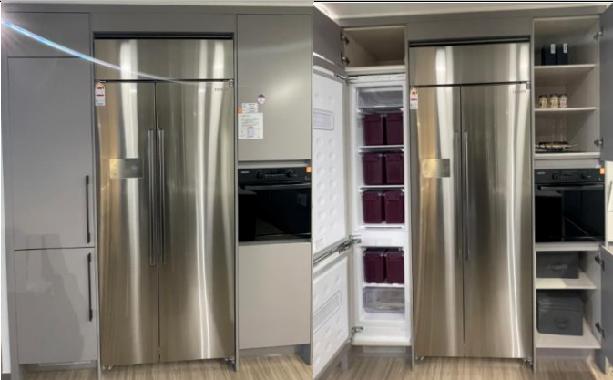
5. 키친 빌트인 수납/가전2 (전타입)