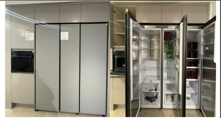
4. 키친 빌트인 수납/가전1 (전타입)