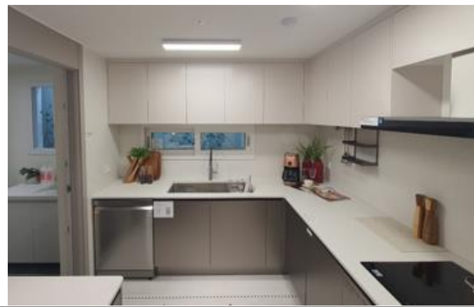
1. 엔지니어드스톤 (주방상판+벽체) (전타입)