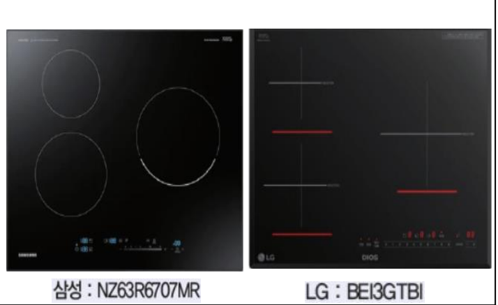
2. 인덕션 3구 국타 (삼성, LG 中 택1) (전타입)