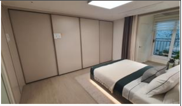
6. 안방불박이장 (전타입)