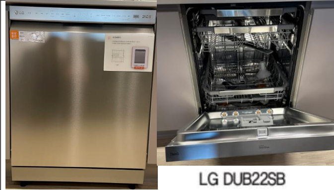
3. 식기세척기(LG) (전타입)